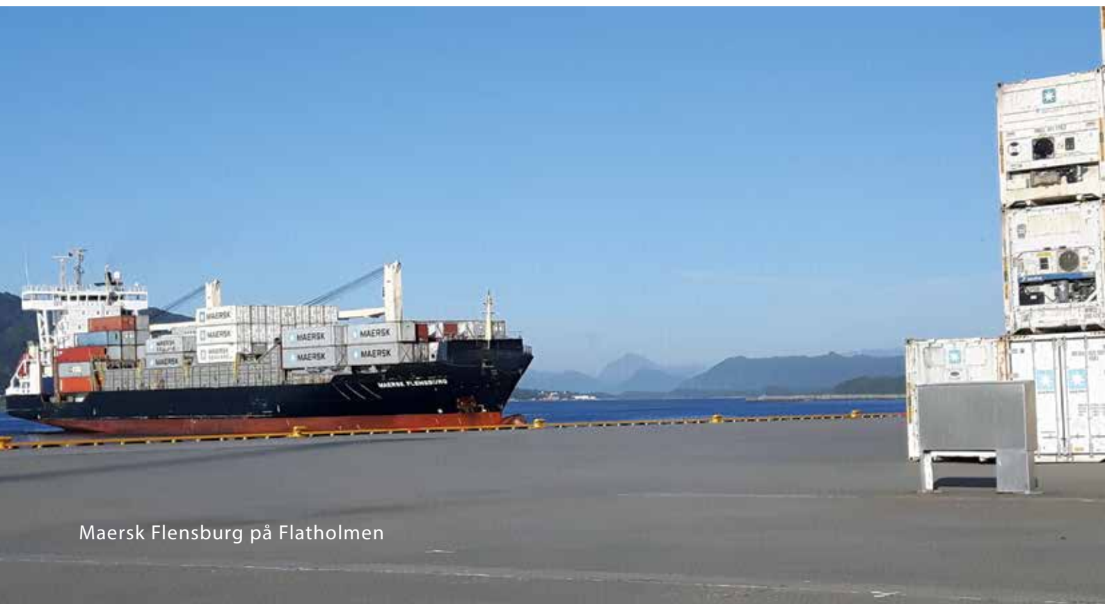
Maersk Flensburg på Flatholmen