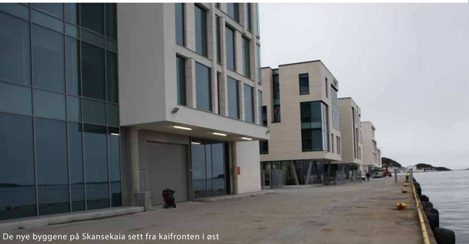
De nye byggene på Skansekaia sett fra kaifronten i øst