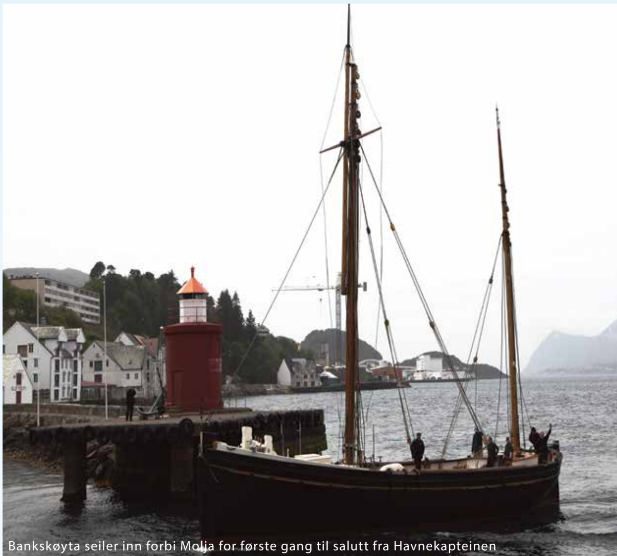
Banksøyta seiler inn forbi Molja for første gang til salutt fra Havnekapteinen