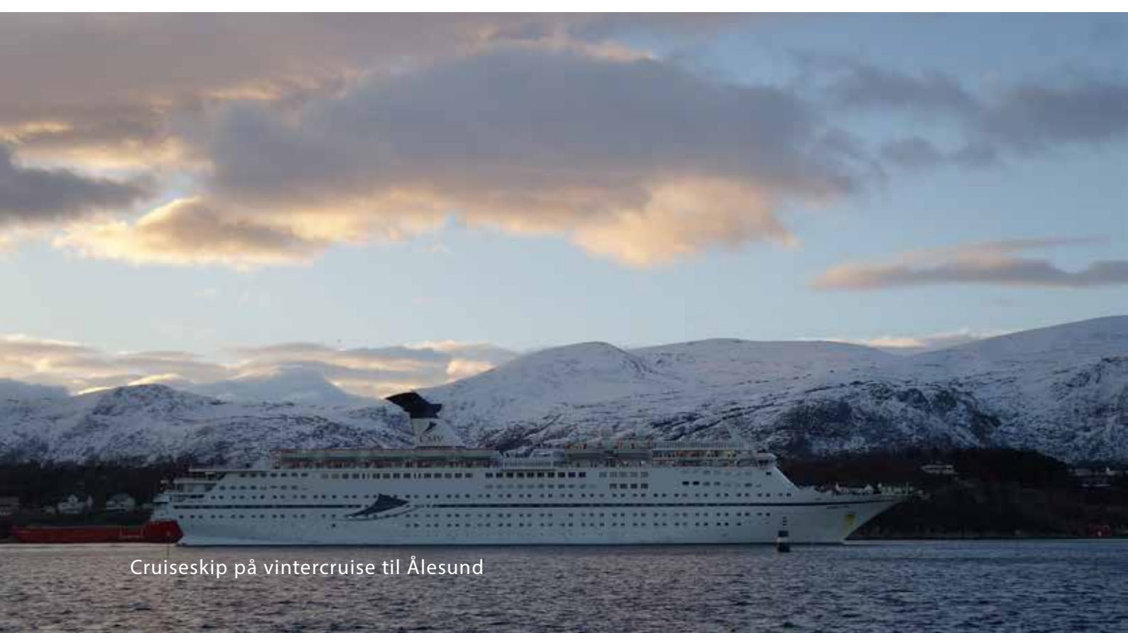
Cruiseskip på vintercruise til Ålesund