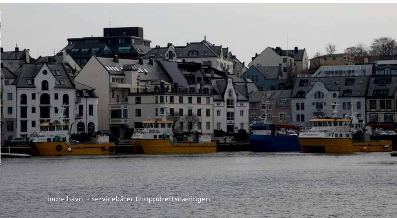
Indre havn - servicebåter til oppdrettsnæringen