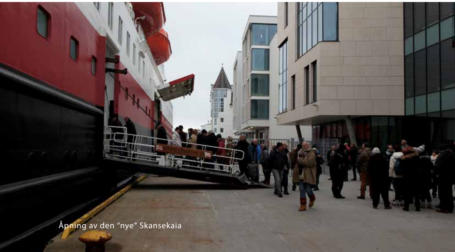
Åpning av den "nye" Skansekaia