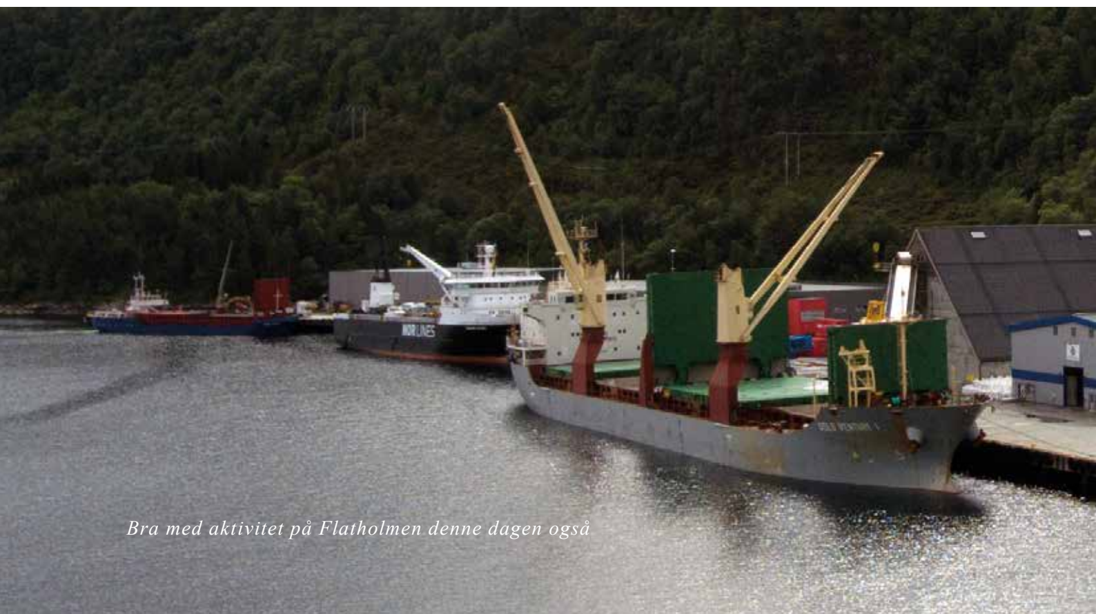
Bra med aktivitet på Flatholmen denne dagen også