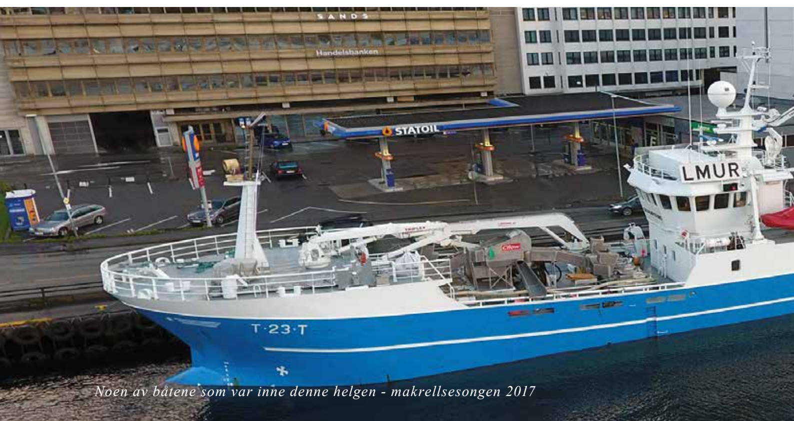
Noen av båtene som var inne denne helgen - makrellsesongen 2017