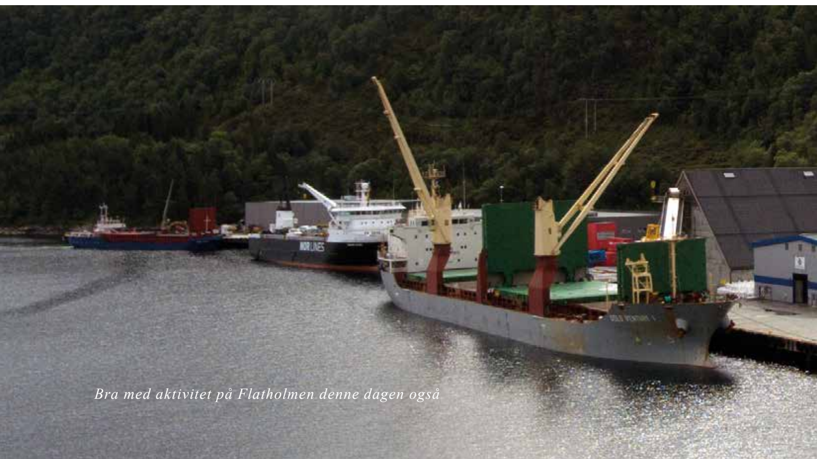
Bra med aktivitet på Flatholmen denne dagen også