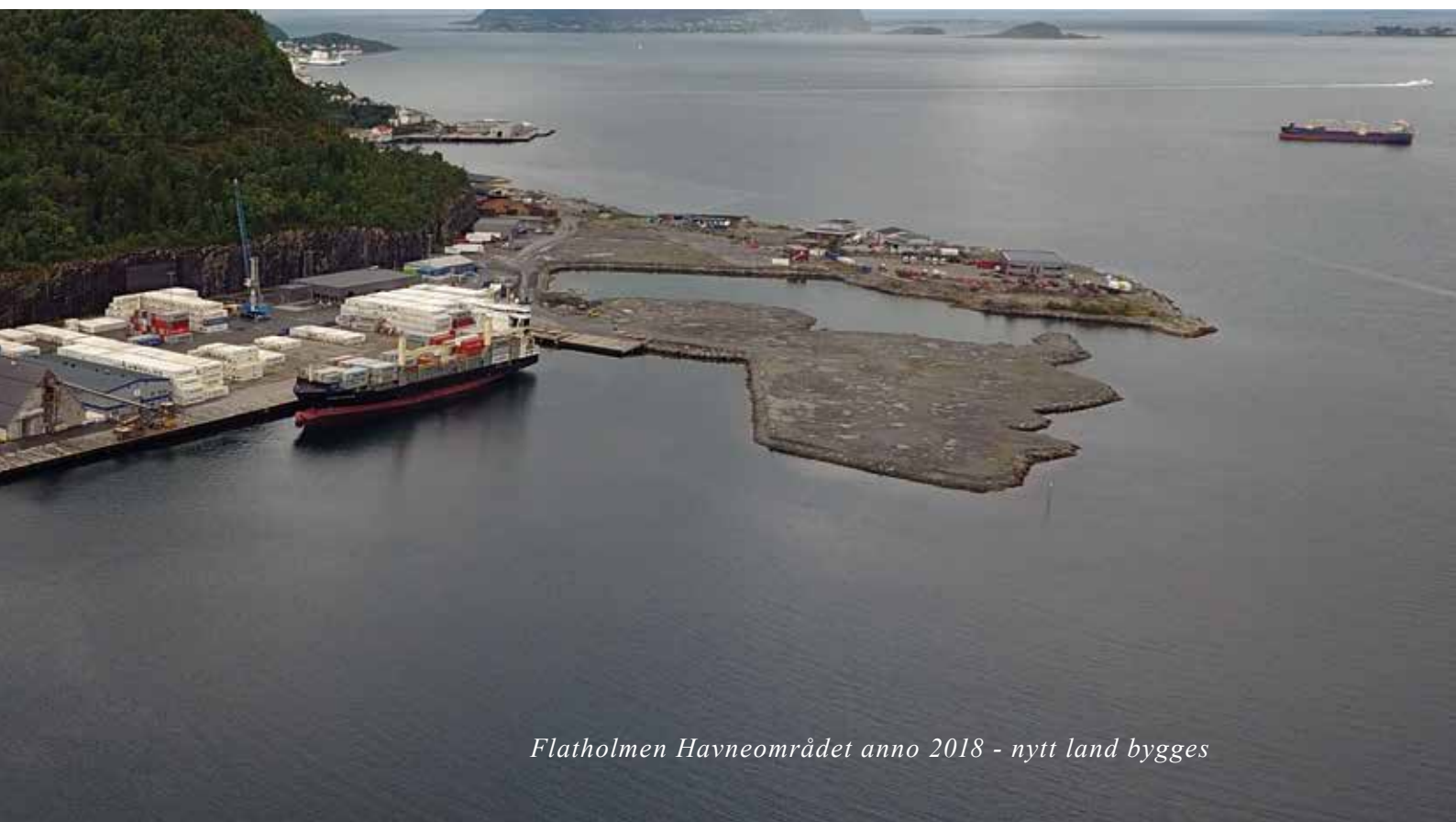
Flatholmen Havneområdet anno 2018 - nytt land bygges