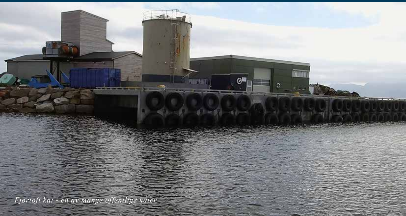
Fjørtoft kai - en av mange offentlige kaier